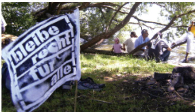
Pause: Auch die Fahnen ruhen aus

Die Stimmung unter den TeilnehmerInnen ist gut. Auch auf den abgeschiedensten Wegen mit wenigen PassantInnen wird gesungen und man skandiert Parolen. Dabei löst der schulreise-ähnliche Umzug bei einigen Unbeteiligten eine gewisse Verwunderung aus – nicht weiter erstaunlich, da dies wahrscheinlich die grösste Demonstration ist, die ein Dorf wie Nänikon oder das Naturschutzgebiet beim Greifensee je gesehen hat. In der Stadt