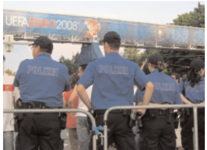
Unter dem Willkommensbanner der Uefa: Alles Polizei

Viel bedenklicher jedoch als diese Vorfälle sind die strukturellen Entwicklungen im Sicherheitsbereich, die im Zusammenhang mit der EM stattgefunden haben. Im Vorfeld wurden massive Bedrohungsszenarien aufgebaut, die das gigantische Sicherheitsaufgebot legitimieren sollten. Der äusserst undifferenziert verwendete Ausdruck «Hooligan» wurde zum Inbegriff einer diffusen Gefahrensituation im Hinblick auf die Euro 08. Und für diejenigen, die sich nicht genug vor dem «Hooligan» fürchteten, wurde erwartungsgemäss auch noch der «Terrorist» ins Feld geführt. Vor dem Hintergrund dieser «Gefährdungslagen» konnte dann in aller Ruhe der gigantische Sicherheitsapparat hochgefahren werden, der für jede Bedrohungssituation die richtige Antwort bereit hatte: Datenbanken und Einreisesperren für die «Hooligans», Kampfjets über den Stadien für die «Terroristen», Videokameras, Sonder-