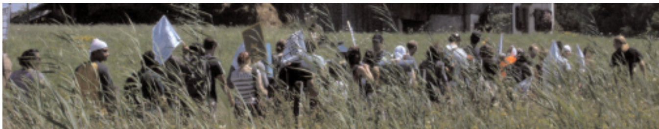
Ein bunter Zug zieht durch die Felder: Die DemonstrantInnen unterwegs zur Notunterkunft in Uster

Etwa 100 Personen, unter ihnen viele Flüchtlinge, versammeln sich am 19. Juli 2008, um in einem zweitägigen Protestmarsch von Stettbach ZH zur Notunterkunft in Uster und weiter zum Ausschaffungsgefängnis Kloten zu wandern. Mit dieser Aktion protestieren sie gegen die Verschärfungen im neuen Asylgesetz, gegen die alltägliche Ausgrenzung der Betroffenen und für ein kollektives Bleiberecht.